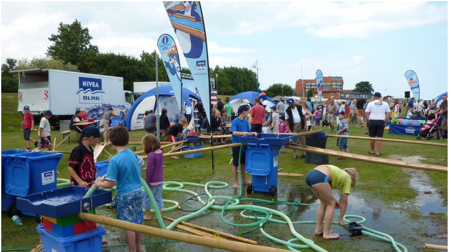
Nivea-DLRG_Strandfest Schillig 1.jpg