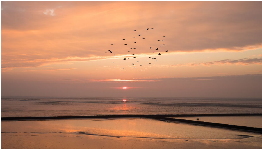
Image-wangerland-zugvogel-Martin Stöver.jpg

Vom 12. bis zum 20. Oktober 2024 dreht sich an der niedersächsischen Nordseeküste und auf den Ostfriesischen Inseln wieder alles um Zugvögel, die im Herbst zu Tausenden aus dem hohen Norden ins Wattenmeer kommen. Zahlreiche Veranstaltungen zum Vogelzug finden auch im Wangerland statt.