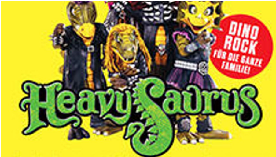
Heavysaurus - Pommegabel Tour 2024 - © links im Bild