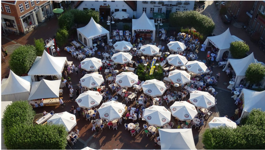
A la carte.JPG