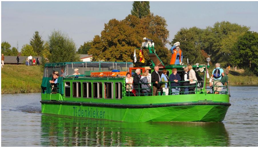
Tidenkieker Schilfparadiese

Tradition, Brauchtum, Volksfest sonstige ... mit dem Boot