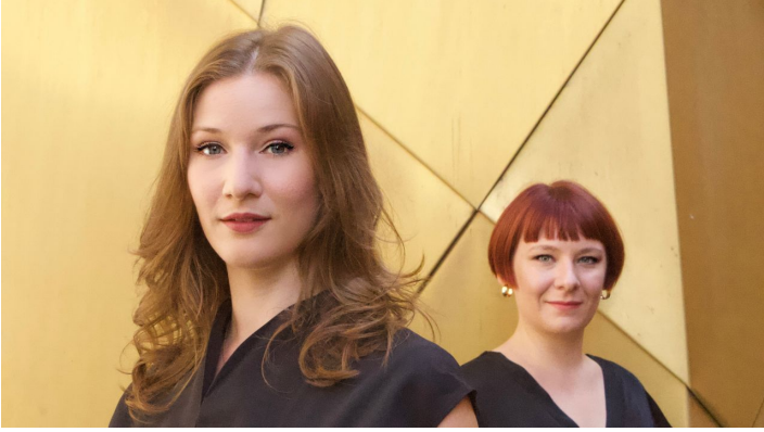
Duo Cantarpa