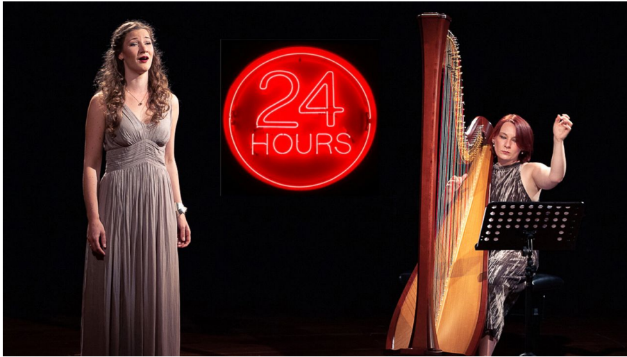
Duo Cantarpa