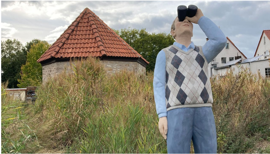
"Alltagsmensch" am Kütelfelsen | Salzkotten