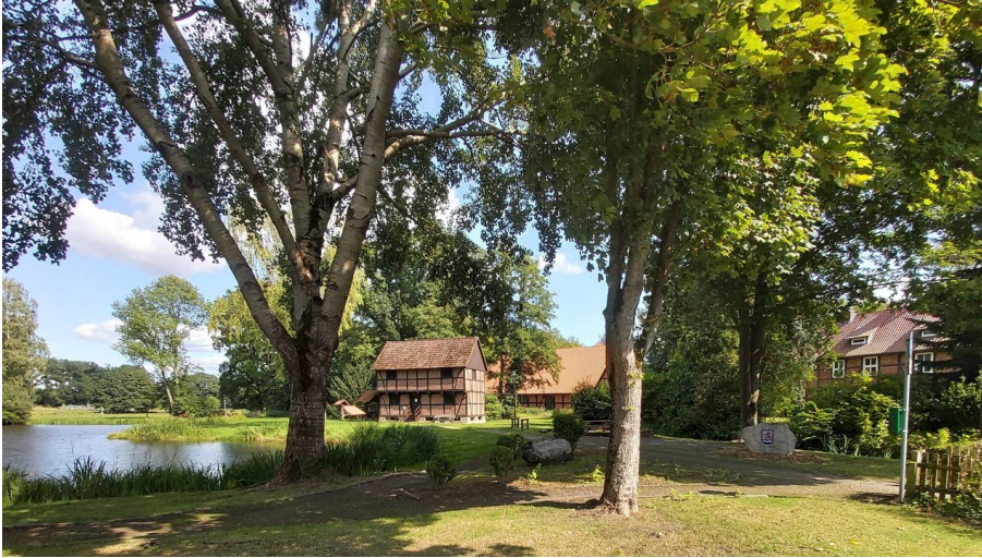
Mühlenteich Knesebeck