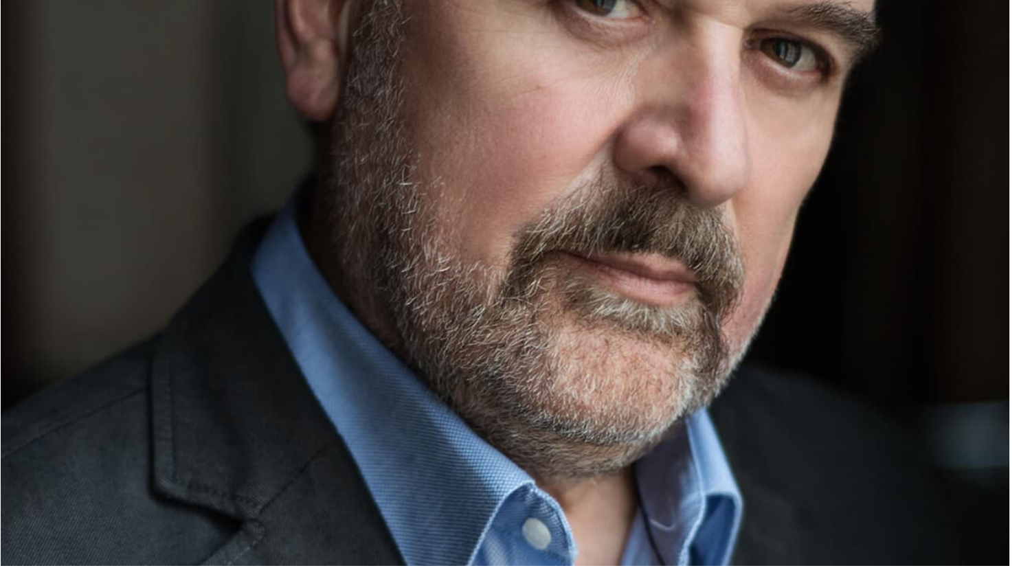
Helmut Deutsch