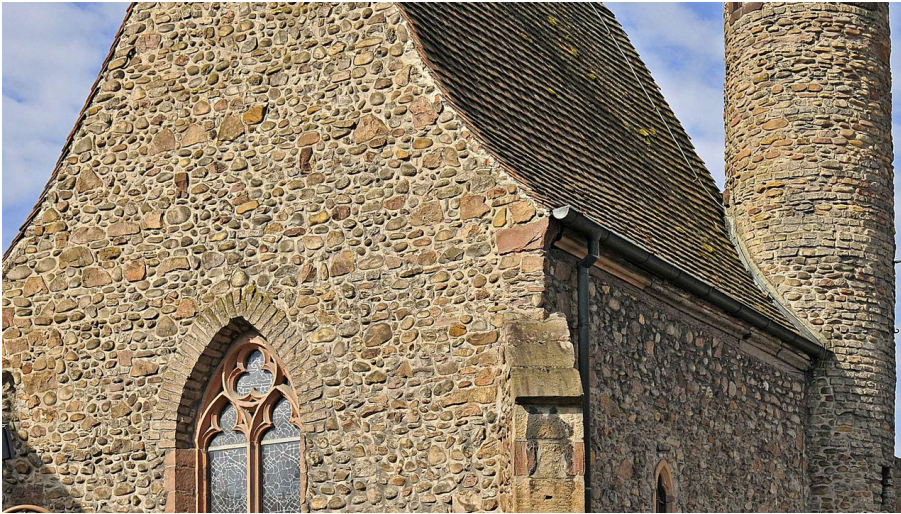
Stadt Achern