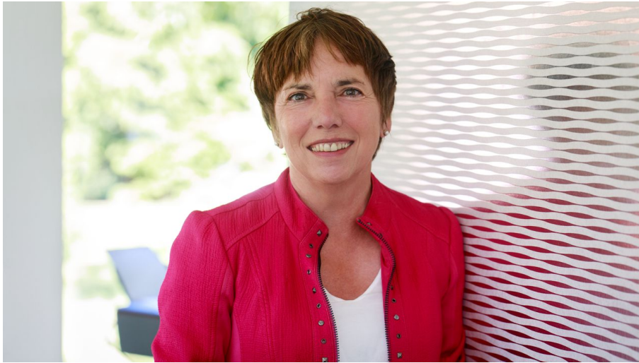
Margot Kaessmann_cJulia_Baumgarten_bearbeitet.jpg