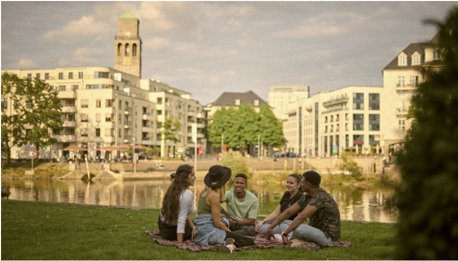
Entspannen an der Ruhr