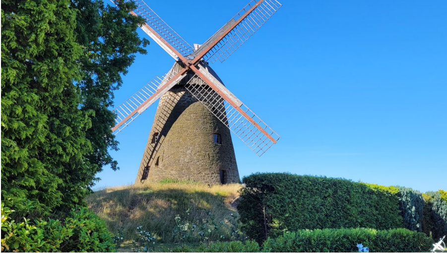
Windmühle Nordhemmern