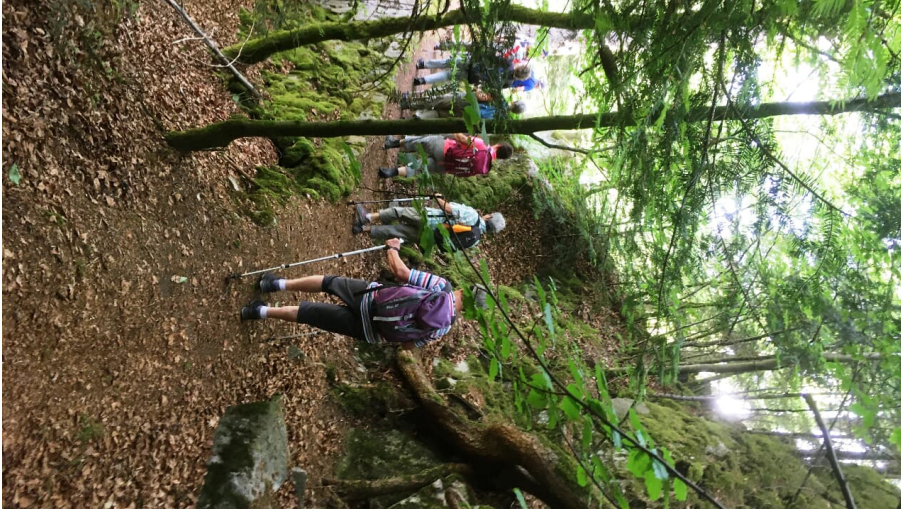
Schwarzwaldverein Achern