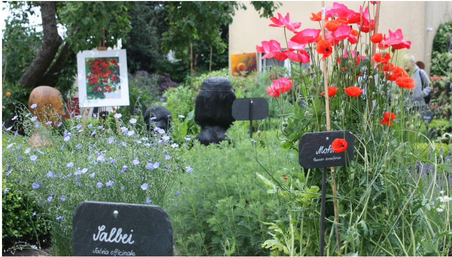
09-06-06_006 KWP Heilpflanzengarten.JPG