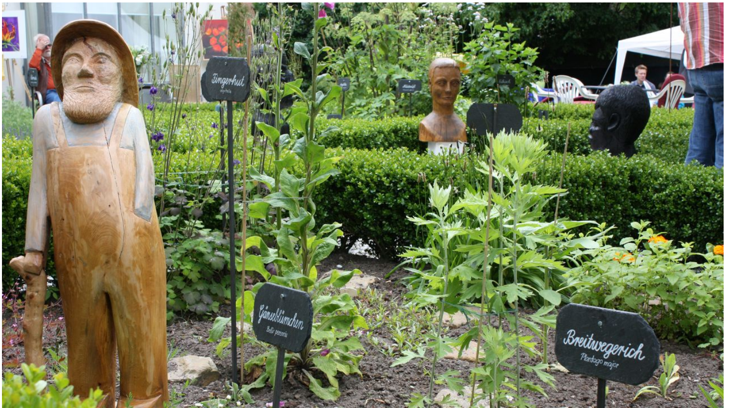
09-06-06_005 KWP Heilpflanzengarten.jpg