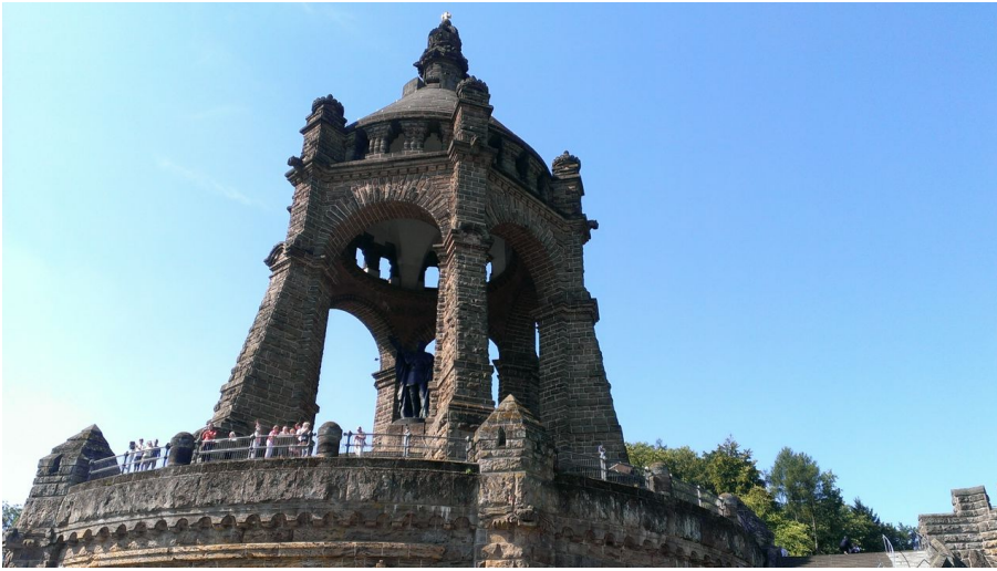
Blick auf Kaiser-Wilhelm-Denkmal