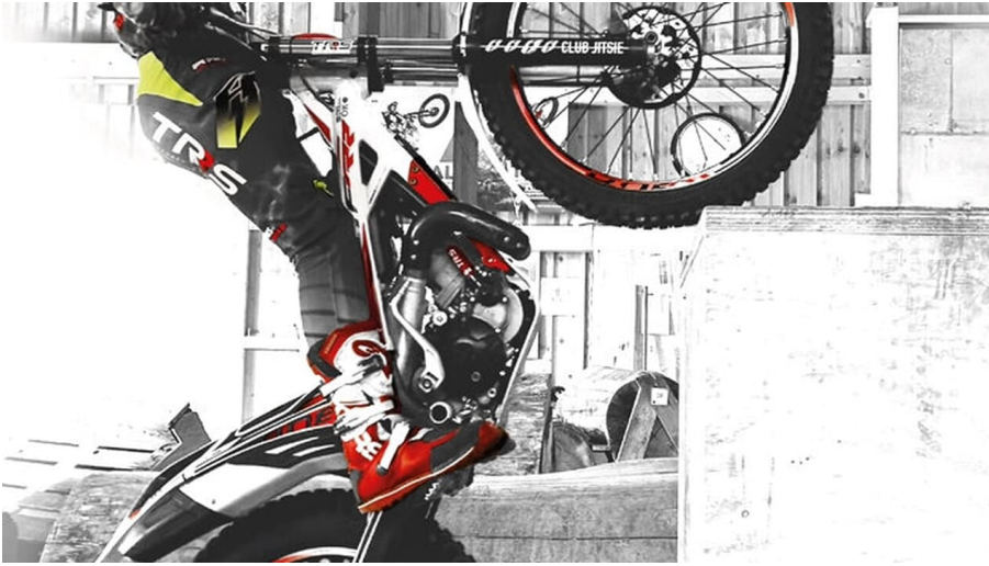
Levin Liffers (12 Jahre alt) zeigt sein Können auf einem Hindernis