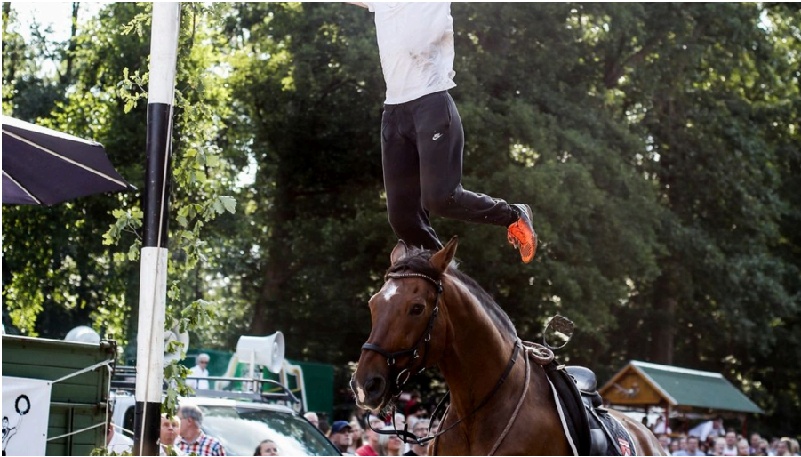
Hahler Kranzreiten 2022 (Stefanie Raulwing).jpg - © Minden Marketing GmbH