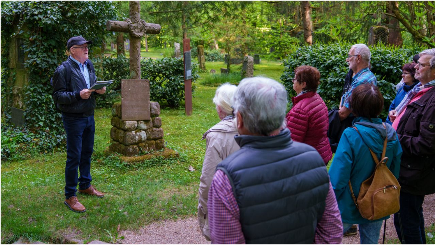
Illenau Friedhof