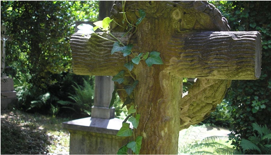
Illenau Friedhof