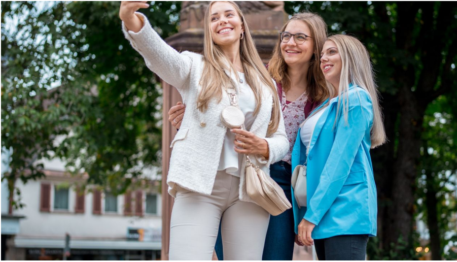
Stadt Achern