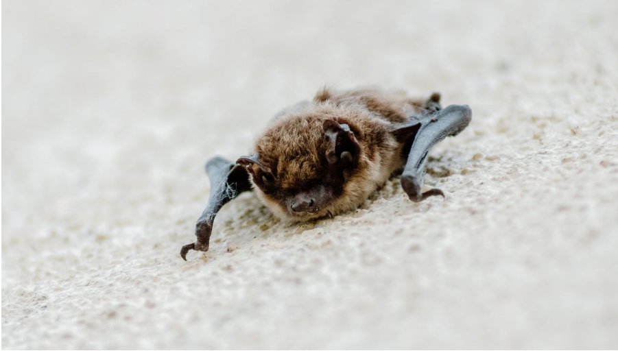
bat-3380678-2.jpg