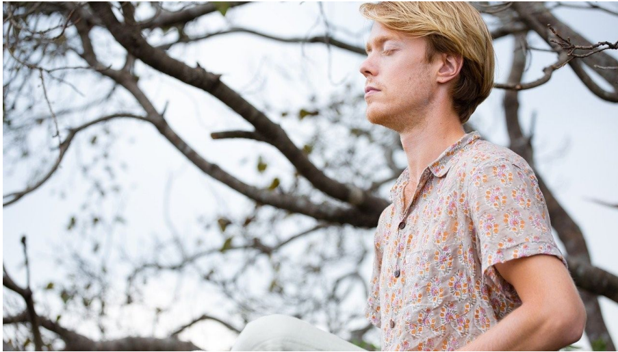
Mann Wald