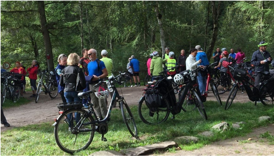
ADFC Radtour