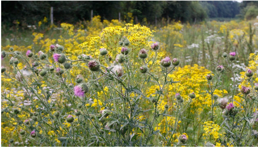
Pflanzen im Spätsommer

Exkursion | Natur | Uhlenkolk | Veranstaltungskalender