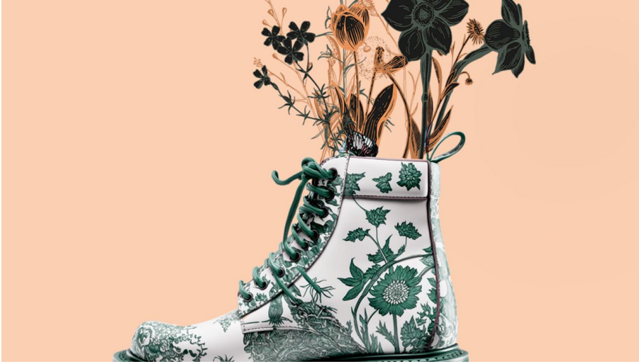
Insta Feedformat 1080x1080 pflanzenwan 5