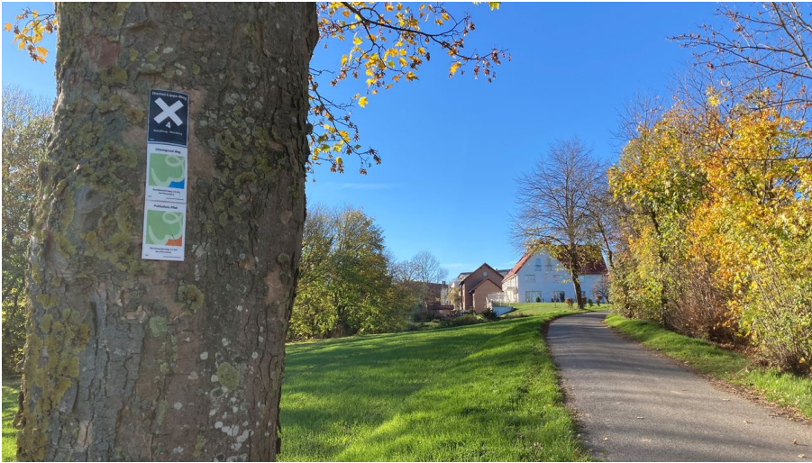
Wandern im Paderborner Land