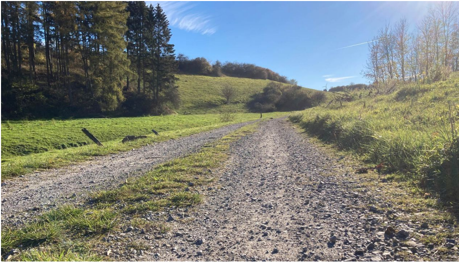
Wandern im Paderborner Land