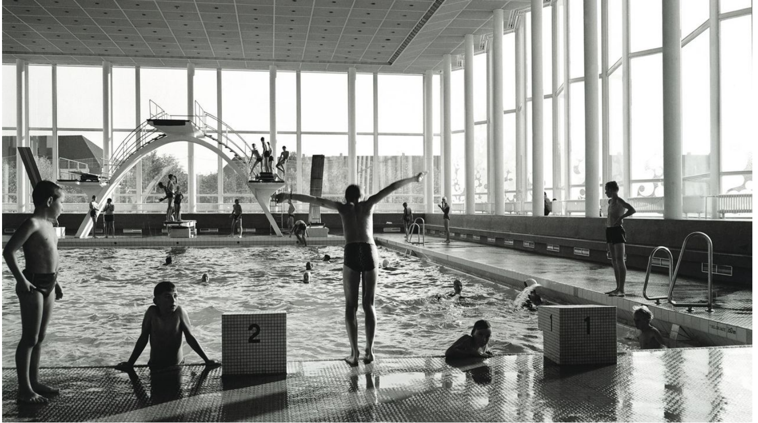
Hallenbad - Lido