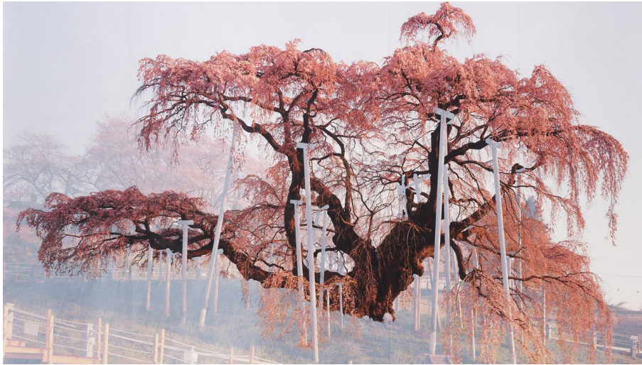
Tacita-Dean-Sakura-I-2022-Tacita-Dean.jpg - © Tacita Dean