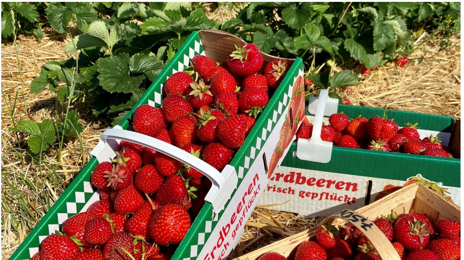
Erdbeeren Frisch vom Feld

Samstag, 14.09.2024, 07:00 - 13:00 Uhr Mittwoch, 18.09.2024, 07:00 - 13:00 Uhr Samstag, 21.09.2024, 07:00 - 13:00 Uhr Mittwoch, 25.09.2024, 07:00 - 13:00 Uhr Samstag, 28.09.2024, 07:00 - 13:00 Uhr Mittwoch, 02.10.2024, 07:00 - 13:00 Uhr Samstag, 05.10.2024, 07:00 - 13:00 Uhr Mittwoch, 09.10.2024, 07:00 - 13:00 Uhr Samstag, 12.10.2024, 07:00 - 13:00 Uhr Mittwoch, 16.10.2024, 07:00 - 13:00 Uhr Samstag, 19.10.2024, 07:00 - 13:00 Uhr Mittwoch, 23.10.2024, 07:00 - 13:00 Uhr [...]