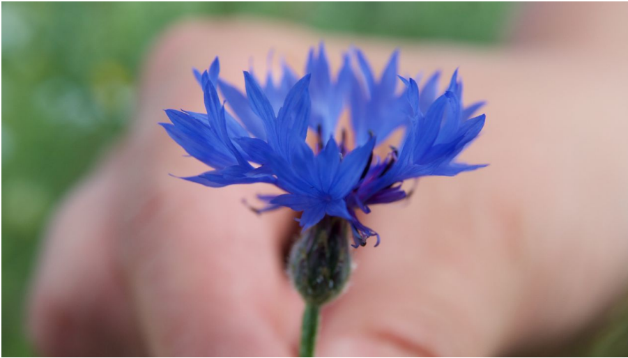
Kräuterführung - Apotheke am Wegesrand; Elfi Paasch