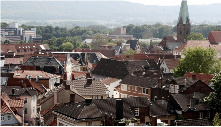
Verborgene Schätze.jpg