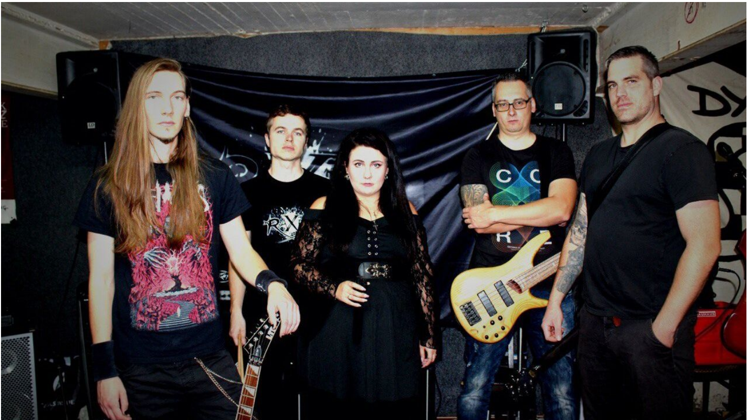
Die Künstlerin und Künstler von RaXem auf einem Gruppenbild. Während der Juryberatung spielen RaXem (Sieger Salzig-Bandcontest 2022) und Kurzmal (Sieger 2023).