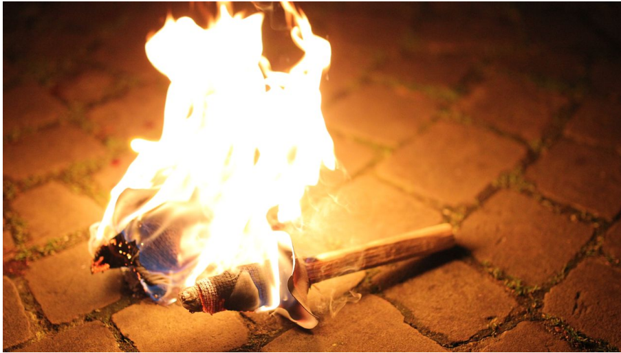
Hexenführung Fackel.JPG