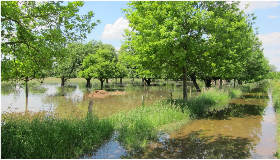
Spaziergang zwischen Altem und Neuem Rhein - Horst Josten - © Horst Josten