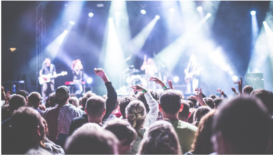
Live in Bad Driburg