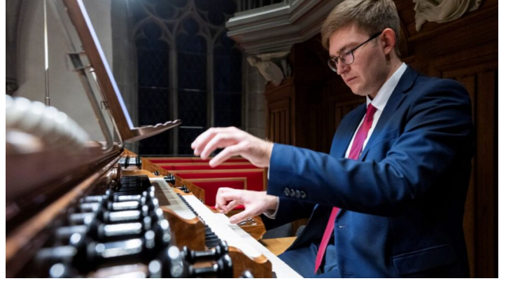
BH1 Herb_Marius_©-Michael-Zanghellini.jpg - © Michael Zanghellini