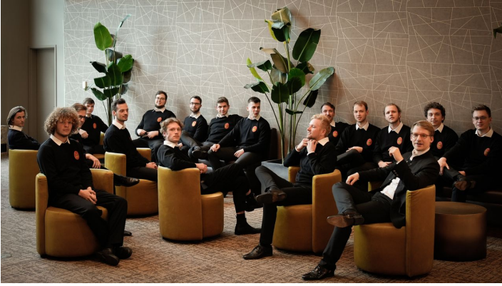
BJ1 Augsburg Domsingknaben_©_Valentin Wohlfarth.jpg - © Augsburg Domsingknaben, Valentin Wohlfarth