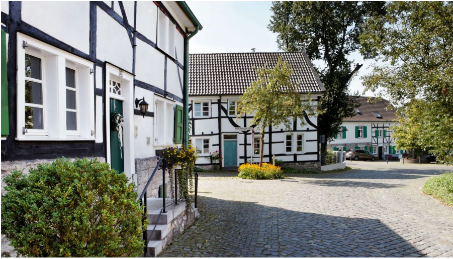
Haan-Gruiten nach Wülfrath-Düssel - Karl-Heinz Hadder - © Kreis Mettmann, Martina Chardin