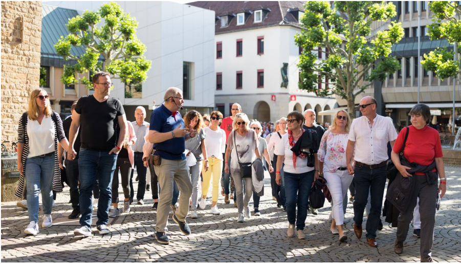
190615-3x30-FotoChristianSchwier-023.jpg - © Christian Schwier