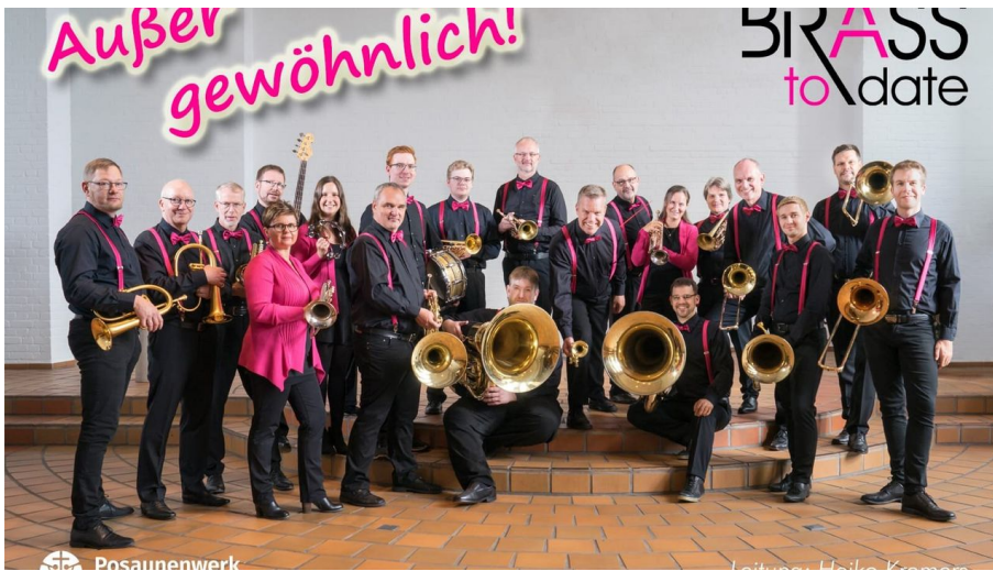
BTD-Gruppenfoto_Außer_gewöhnlich.jpg - © Sabina Baraucke-Schulz