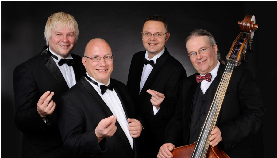
Jörg Hegemann mit Rhythmusgruppe und Sänger