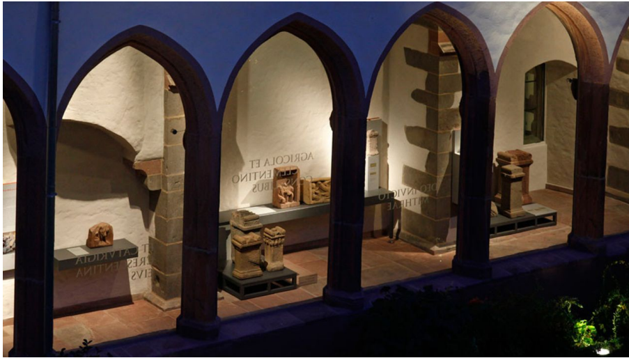
Archäologisches Museum Frankfurt Kreuzgang Lapidarium