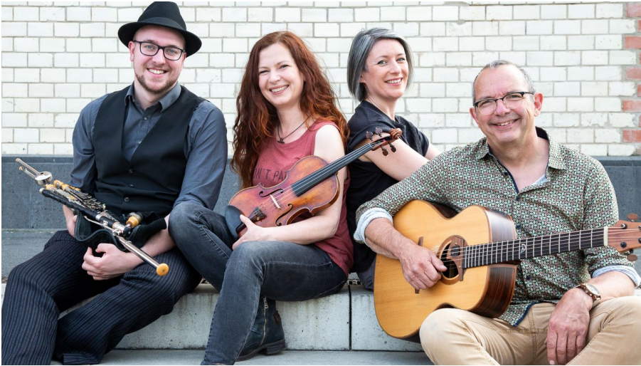
CARA - © Samira Schulz