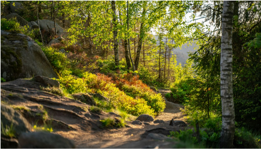
Wald (2).jpg