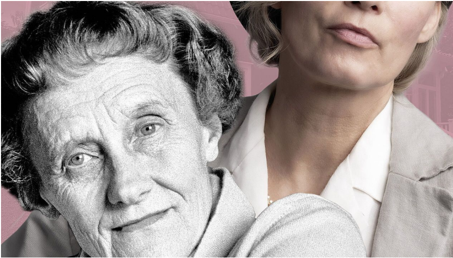
Stefan Nimmesgern, Isolde Ohlbaum laif, akq-images Doris Poklekowski