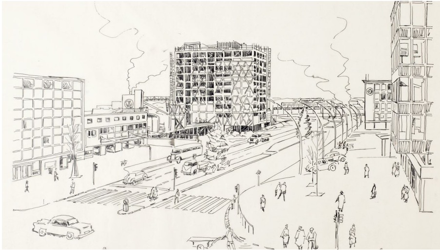
VM 060711_01.jpg