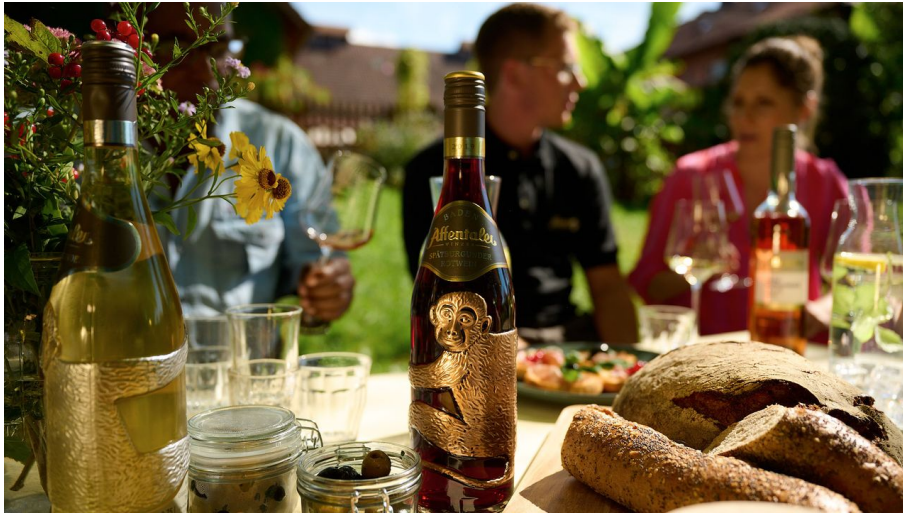
Affentaler Winzer eG