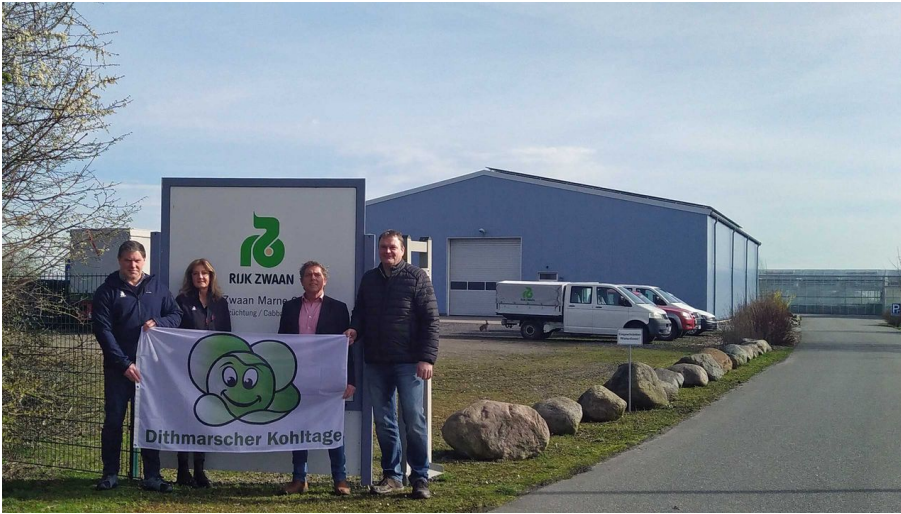
Kohlanschnitt 2024: bei Rijk Zwaan in Marne