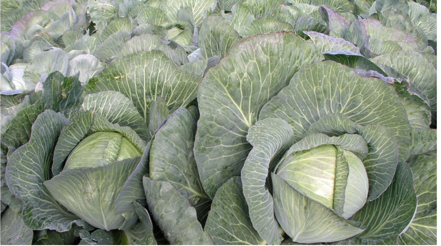
Dithmarscher Kohl