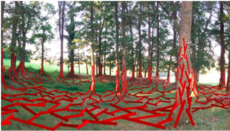
WIR - © Daniel Duchert