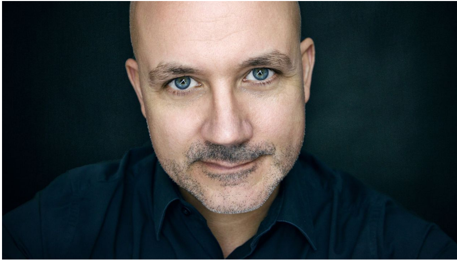
Frank Fischer c Olli_Haas - © Frank Fischer c Olli_Haas